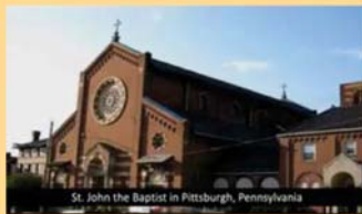
St. John the Baptist in Pittsburgh, Pennsylvania