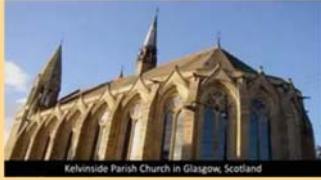
Kelvinside Parish Church in Glasgow, Scotland