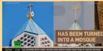
HAS BEEN TURNED INTO A MOSQUE