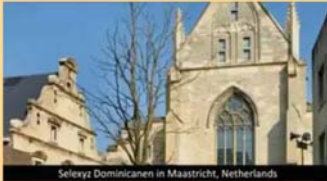
Selenyz Dominicanen in Maastricht, Netherlands