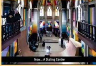
Now... A Skating Centre