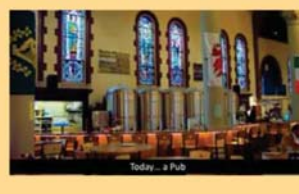
Today... a Pub