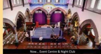
Now... Event Centre & Night Club