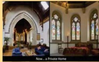
Now... a Private Home