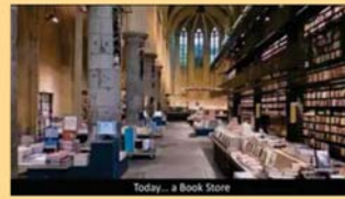
Today... a Book Store