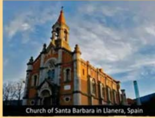
Church of Santa Barbara in Llanera, Spain